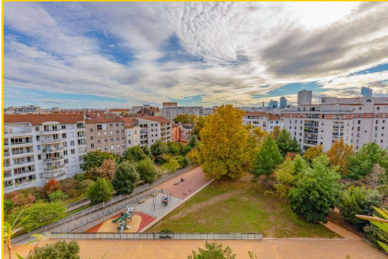
Vue depuis la terrasse Sud